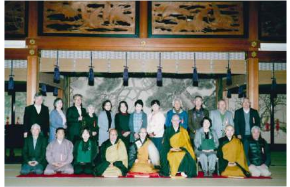
大本山永平寺瑞世拝登記念 平成29年3月29日

ずいせ 瑞世とは修行中の黒色の袈裟を黄色に改めることで、曹洞宗 では両本山で一夜住職の儀式を済ませた後に認められます