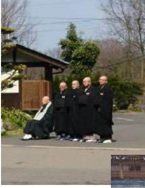
ご誕生寺にて 三明寺落慶に おいでになった 元曹洞宗管長 板橋禪師