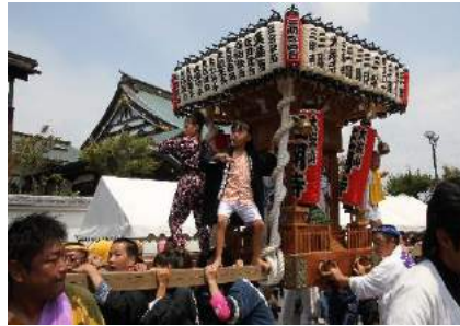
約30団体の神輿会のみなさんが参加し 祈願の後に門池を一周渡御しました