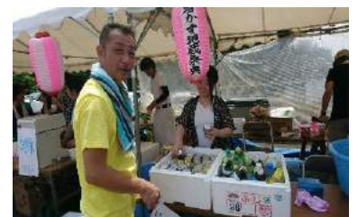
役員さん 暑い中ご苦勞様でした