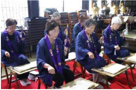
梅花講による御詠歌奉詠