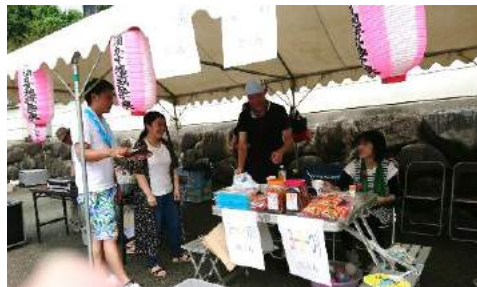
裾野 ら・ら・らのスタッフが駄菓子 ヨーヨーをご奉仕いただきました