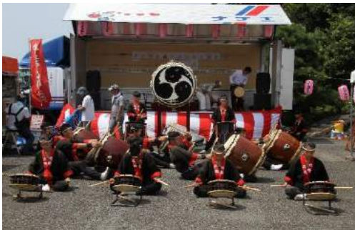
飛龍高校飛龍太鼓と町内小林囃子がお祭りを盛り上げてくれます