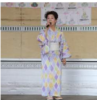
歌手八木春子さんの歌声が華を添えます