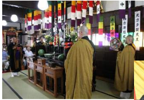
本堂内特設の施餓鬼棚