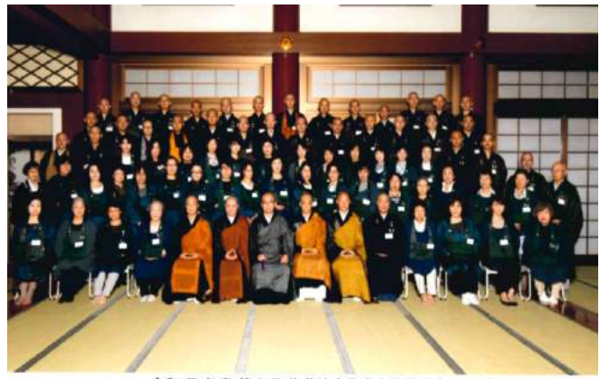
和元年8月28日~30日 令和元年度第5回梅花流宗務庁主催講習会 北海道中央寺