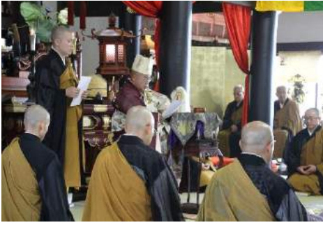
近隣のご寺院様のご先祖様のご供養をいたしました