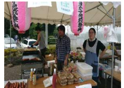
やきそばは息子達の幼なじみが担当 トングさばきはプロ並み!