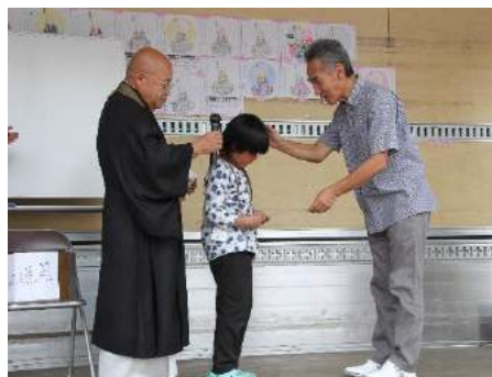
お楽しみ抽選会 ♥特賞熱海温泉一泊 一等賞 空気清浄機