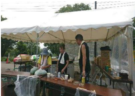
バエリアは 味いちもんめ の親方が監修 今年が一番の出来上がり!