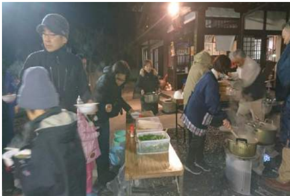
年越しそば・おしるこ・甘酒 多くの方が見えました