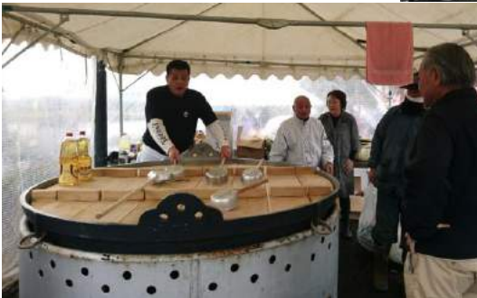
千人鍋じぞう汁や模擬店は大人気