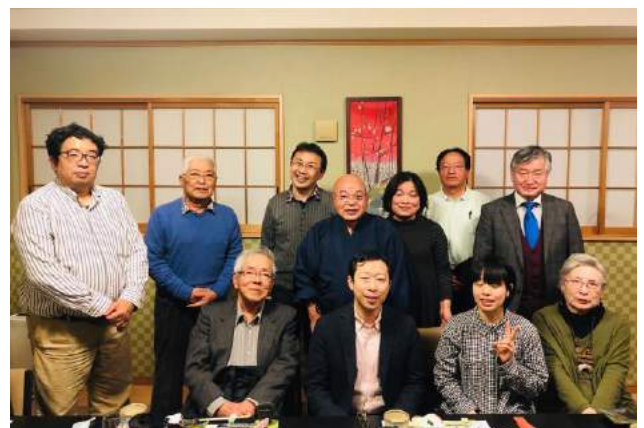
寄席役員さんと親睦会