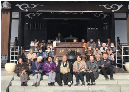
老人施設の皆さんとはしご乗りを見ました