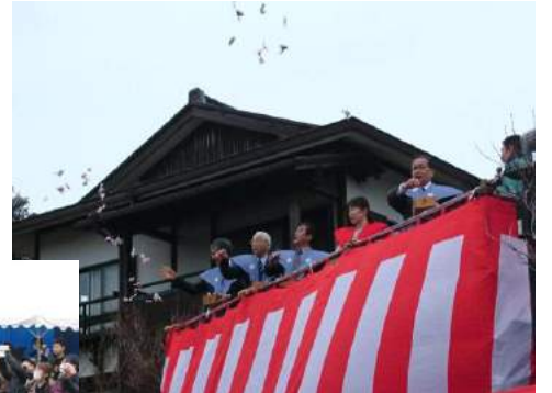
朝の雨もお昼にはやんでくれました