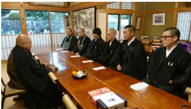
弟子が揃い 新年の挨拶