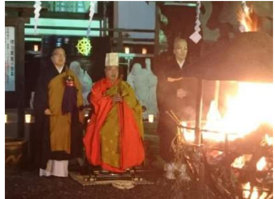
1年の煩惱を払い新年の幸を祈ります