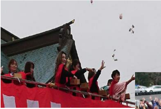
お寺の豆まきは「福は内」だけ