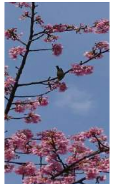
河津桜とメジロ 三明寺