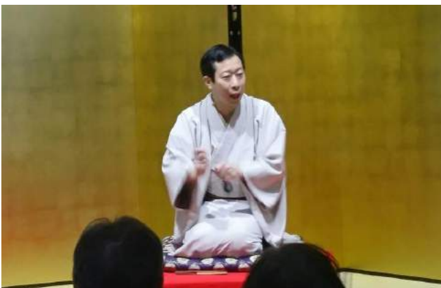
第126回じぞう寄席 2/23 古今亭菊之丞師匠