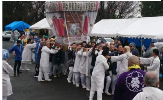
雨の日も御輿を護ってかつぎます