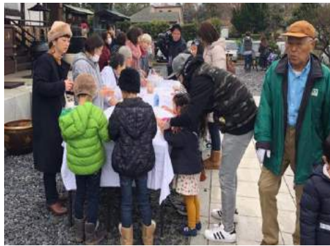
つきたてのおもちに大行列 鏡餅も作ります