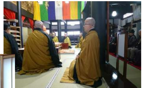
近隣のお寺さんが集まり 家内安全など御祈禱いたします