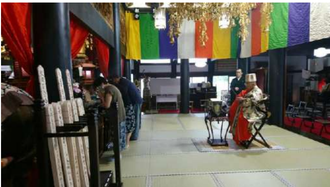
彼岸会ペット供養 9/20