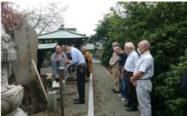
印章供養祭 10/4 公官庁での印は省略されるとはいえ印章は個人を表す日本の文化ですね