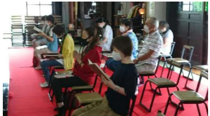
密集を避けるため時間を分けて開催しました