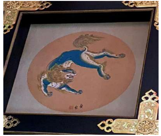
口を開けている黒い唐獅子