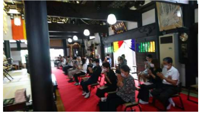
亡くなられた方々を偲びます