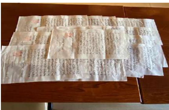
写経会 一文字一文字気持ちを込めて般若心経を写します