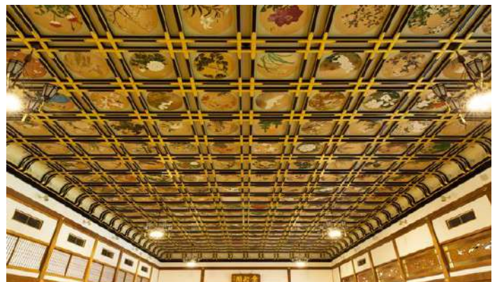
永平寺傘松閣の天井

碁盤目に組んだ角材の上に裏板を張った天井 中央部を一段高くした格式高い重厚なつくりで 将軍や大名の部屋に採り入れられる。 寺院でも大切な仏像をお祀りする本堂などに用 いられ、仏画が描かれる様式もみられる。