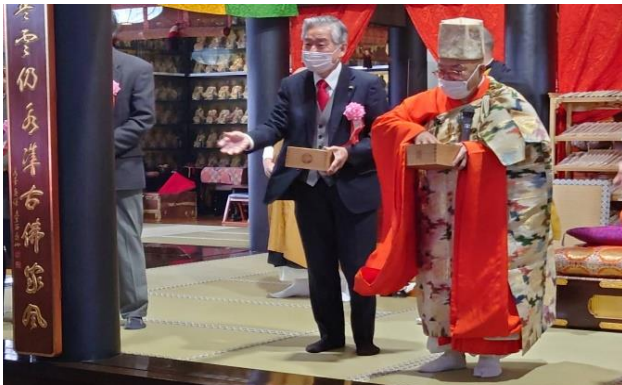
本堂の中で豆まきを行いました。マスクで「福は内」