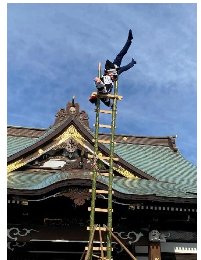
1/6 出初め式のはしごのり