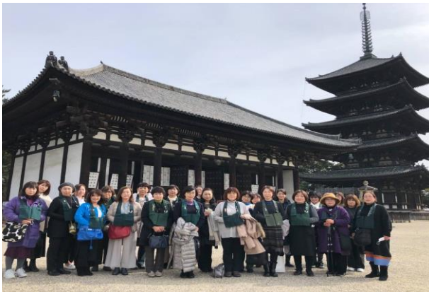
2/6 奈良での寺族研修