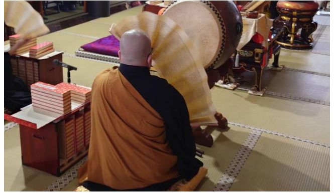
般若心経の転読、パラパラと広げて 600 全巻読んだこととします