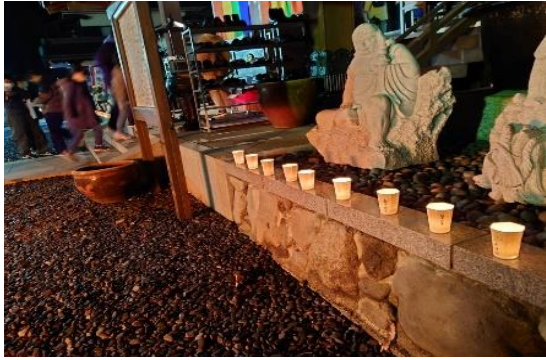
大晦日 本堂前のお灯明