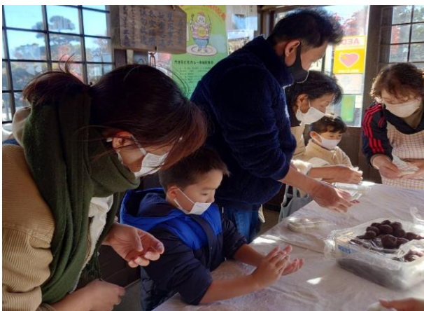
お正月の鏡餅と家で食べられるあんこ餅を作りました