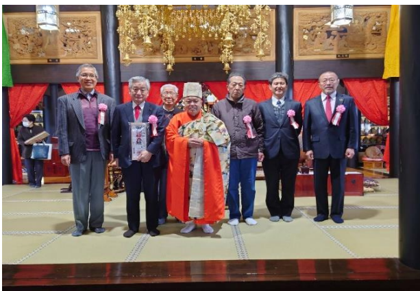
特別祈禱のまめまきをされた皆様