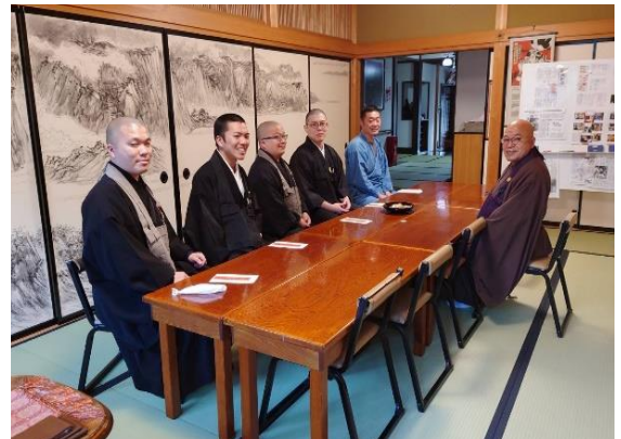
弟子たちと1年の抱負を語ります