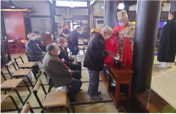
住職より、ありがたい理趣経を両肩に当ててもらいます