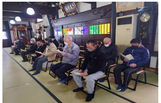
ご祈禱を申し込まれた方のみの方の参列にご協力いただきました