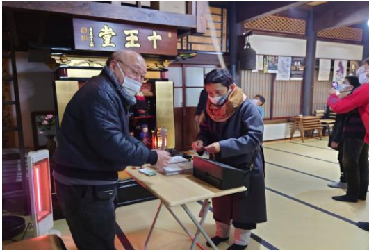
鐘をついた後にお札をいただきます