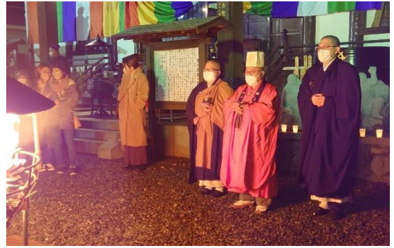
鎮火祭のお経の後、除夜の鐘をつきます