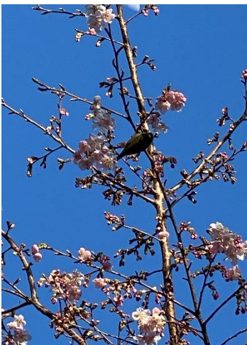
早咲きの桜とメジロ