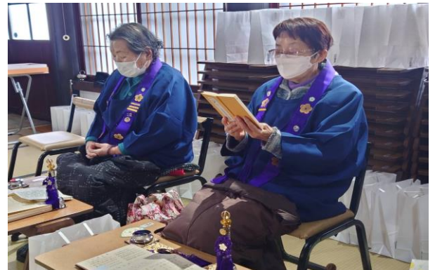
ご詠歌のお仲間を募集しています