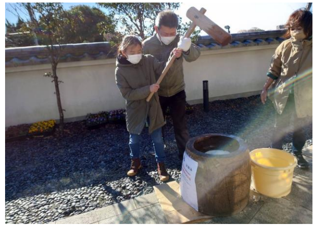
12月18日 三明寺 もちつき会

歳末たすけあい募金の助成があり、一般公開はせず役員と子ども食堂の家族を中心に行いました