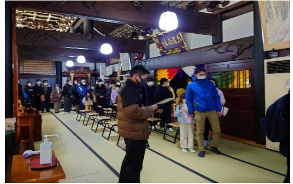
1年の終わり、家族で鐘をつきにお参りをします