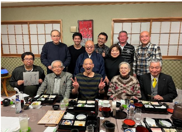
嘶家さんを囲んだ世話人さんの親睦会