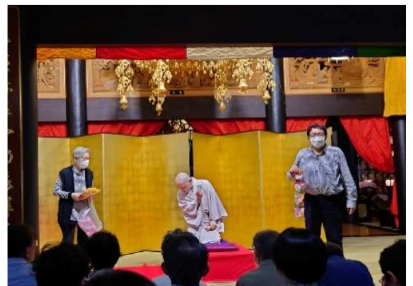
東落語の後の抽選会は楽しみの一つです