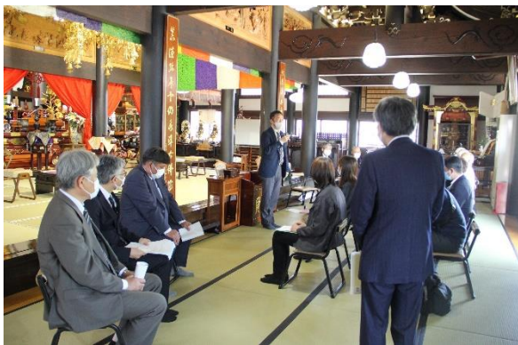
沼津市で第1号のお披露目式