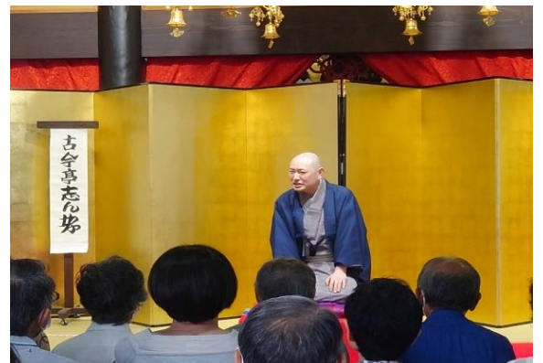
古今亭志ん好師匠