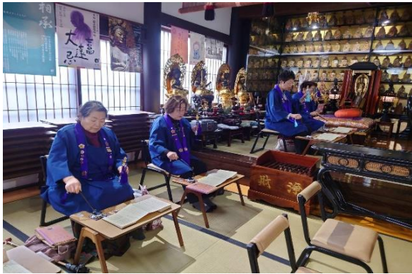
梅花流ご詠歌の奉詠