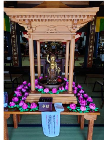
釈尊誕生仏 花御堂