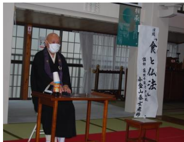
可睡齋 典座 小金山老師 のお話を聞きました