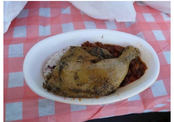
ライオンゲートのカレー弁当を提供しています