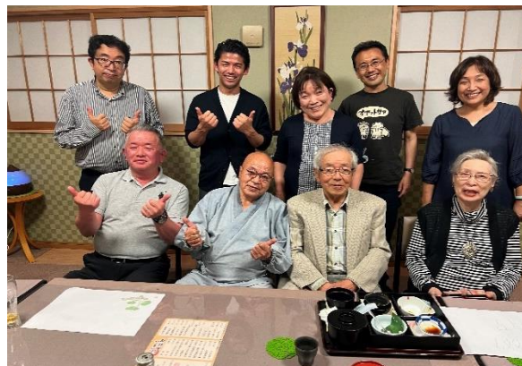
寄席のお手伝いをされている世話人さん