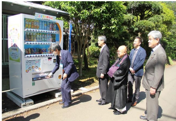
三明寺別館に 子どもの居場所応援自販機設置 売り上げの一部が寄付されます