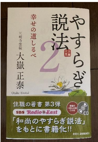
ラジオのお話が本になりました