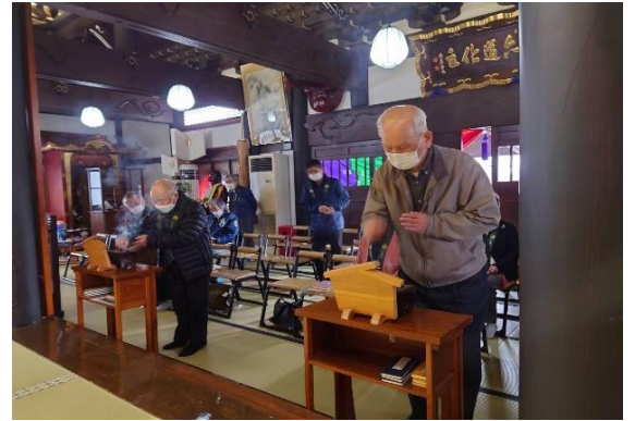
先祖供養・ペット供養をおこないました。