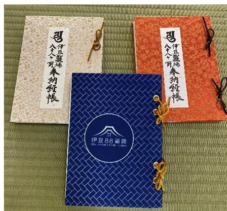
朱印帳を三明寺で扱っています