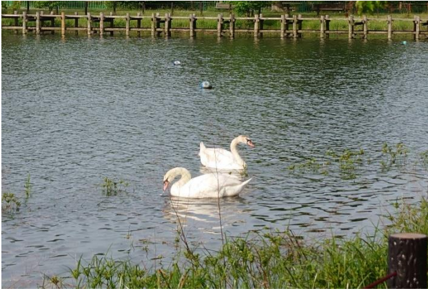
5月18日門池に白鳥が2羽飛来しました。こぶ白鳥です