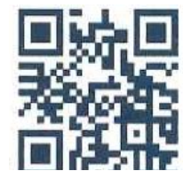
伊豆 88 遍路