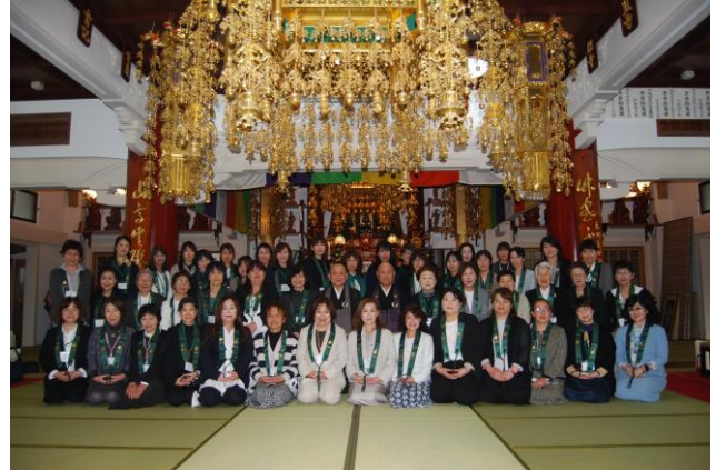
宗務所婦人会総会・研修会 4月25日