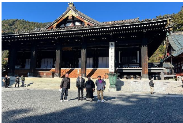
宗務所檀信徒地方研修会 11/26・27