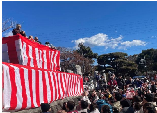
年末年始の行事 もちつき 鎮火祭・除夜の鐘 大般若祈祷・まめまき 多くの地域の皆さんでにぎわいます。 支えてくださる方々がいるからできる三明寺の行事です