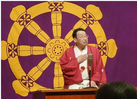
静岡県仏教婦人会県大会 10/16 講師 春風亭昇太郎匠