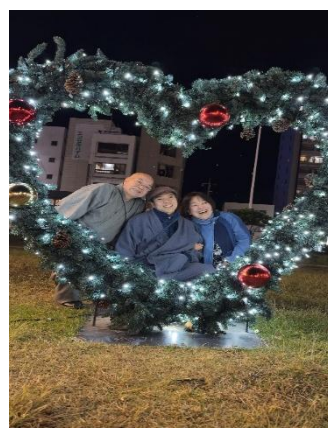
住職兄弟会 11/24 沼津駅北口にこんな撮影スポットがありました