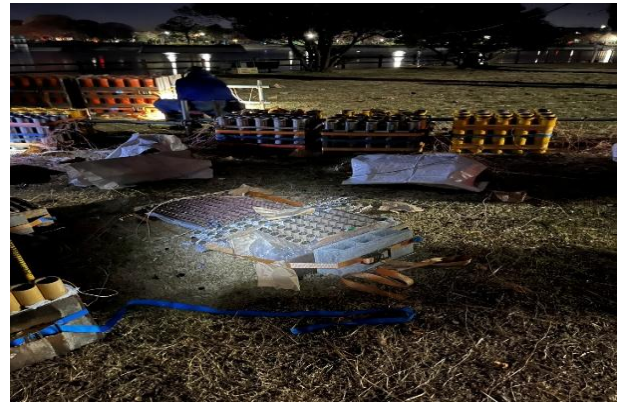
花火点火場所 息子が消防団員だからこそのワンショット