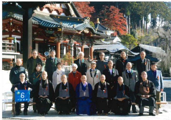
身延山久遠寺、長野県茅野方面