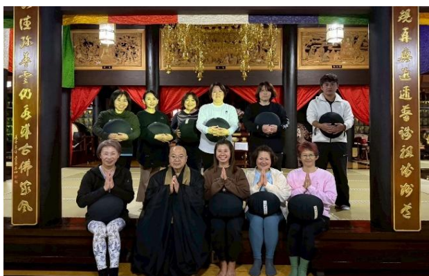
ヨガ坐禅の会 毎月一回 以前に比べ肩こり腰痛が軽減されているような