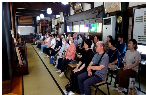
ご先祖様、ペットの供養