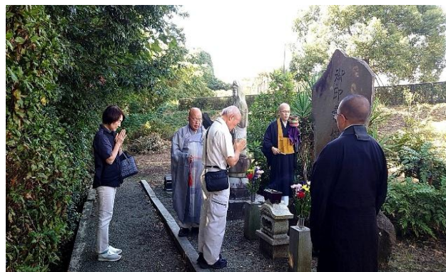
印章供養祭 10/5 省略されてきたとはいえ 印章は必要不可欠。 12月は宅配便に・・・