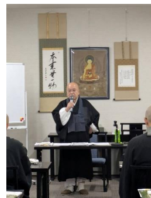
宗務所布教講座 11/19 若手僧侶に対して講習を行いました