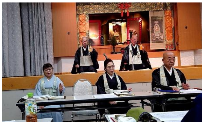
梅花流本庁講習会 京都妙心寺花園会館にて 臨済宗花園流の特別講習でした